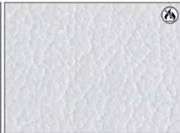
ARCTIC WHITE 96