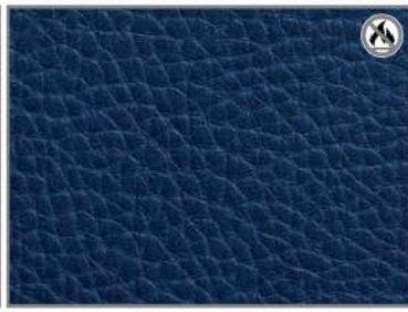
ROYAL BLUE G9