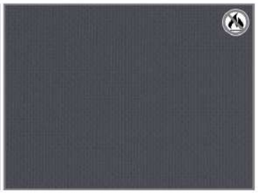
CHARCOAL SATIN H5