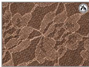
BROWN LACE F8