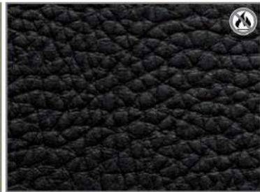
BLACK COFFEE 59