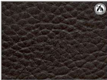
HOT CHOCOLATE 60