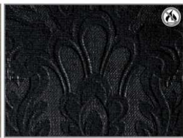
BLACK DAMASK 25