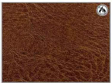
VINTAGE TAN G2