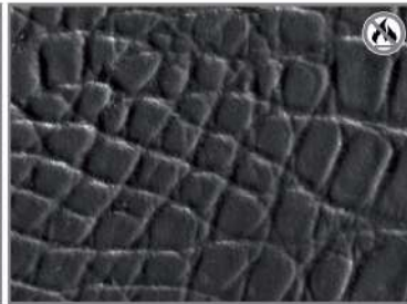
GREY ALLIGATOR 50