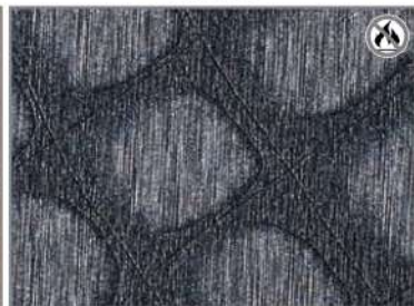
AVIATOR BLUE F7