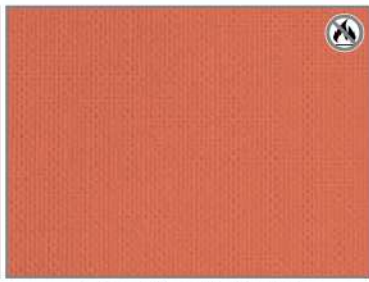
ORANGE SATIN H7