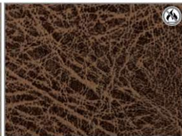
VINTAGE BROWN F5