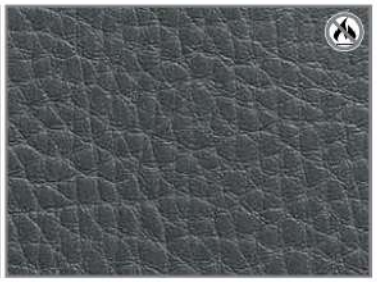
DARK GREY G6