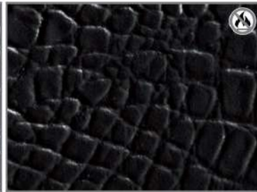
BLACK ALLIGATOR 49