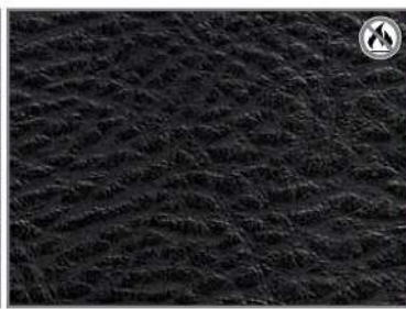
VINTAGE BLACK G1