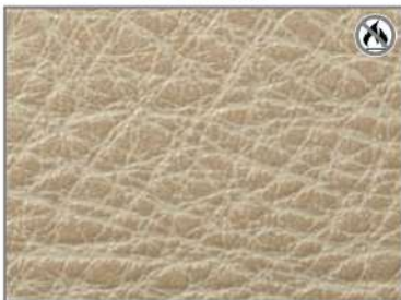
VINTAGE BEIGE F4