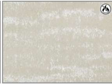
PEARL FUR 41