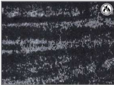
GREY FUR 44