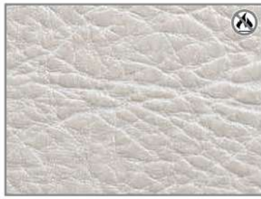
VINTAGE WHITE G3