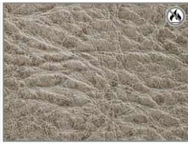
VINTAGE ASH G4