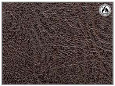
VINTAGE CHOCOLATE H9