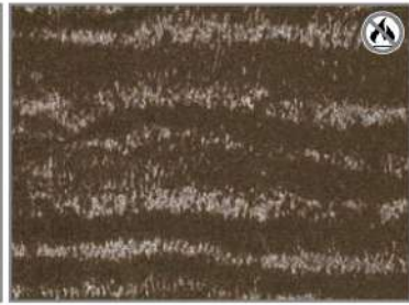
CARAMEL FUR 43