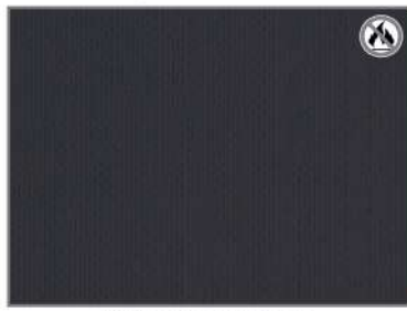
BLACK SATIN H6