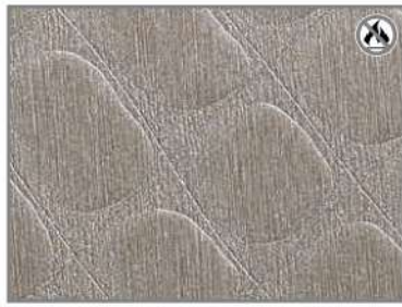
AVIATOR NICKEL G7