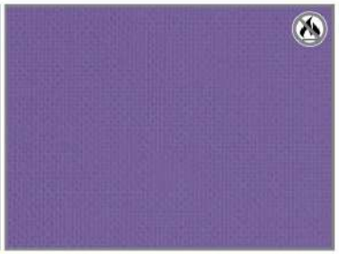
VIOLET SATIN H1