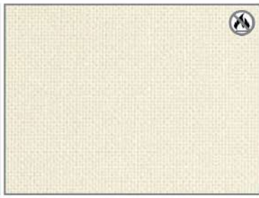
WHITE SATIN H3