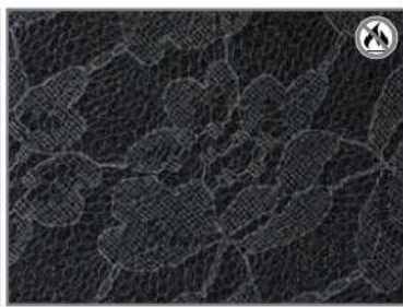
BLACK LACE F9