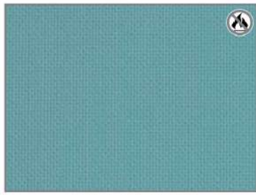
AQUA SATIN H2