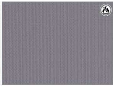
GRAPHITE SATIN H4